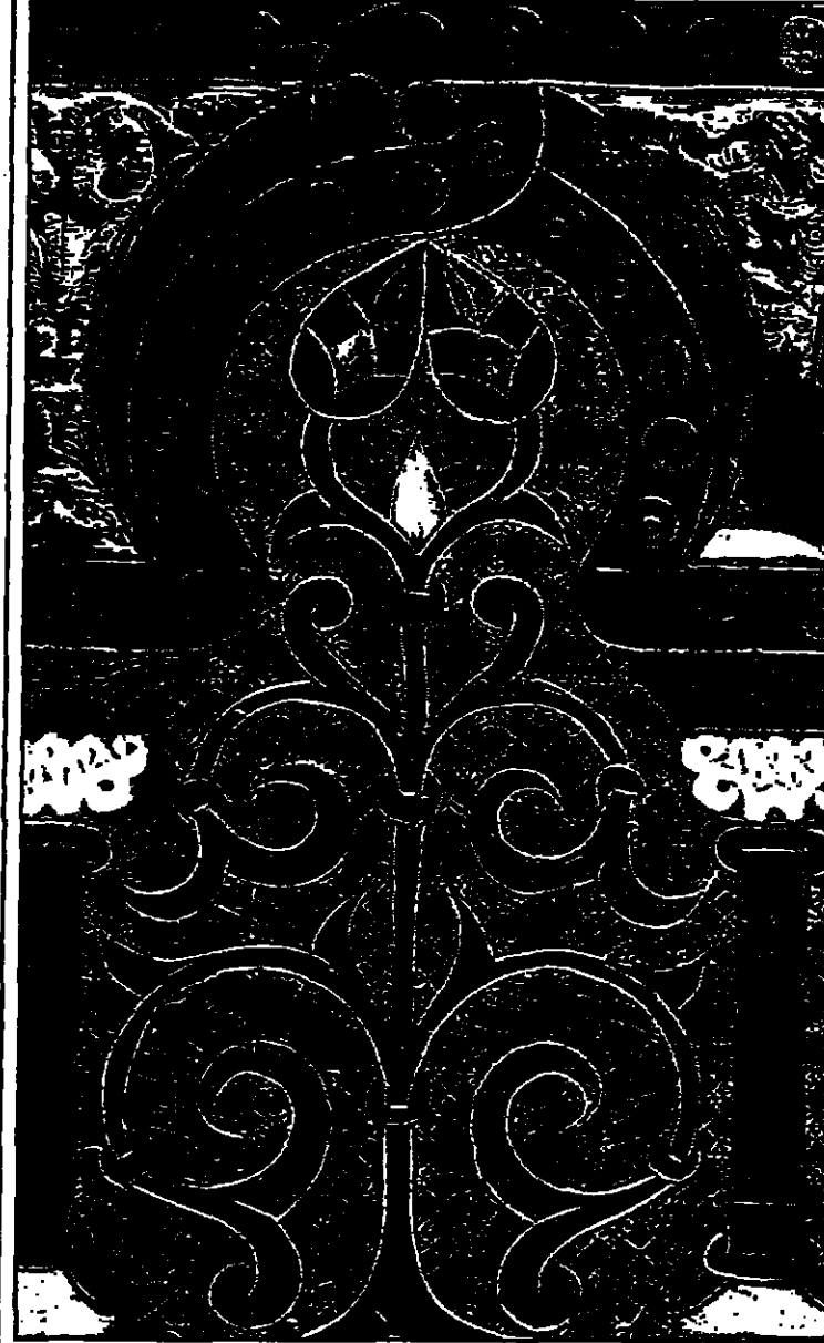
من زخارف منبر الكتبية في مراكش

لستخمة في زخارف المنبر، ولذلك ازدهت جميع سلطون المغرب، واستخدمت مجموعة من اساليب التنظيف لهذه العملية الفنية، فتم اعتماد الطريقتين الصالحة والارضية كليهما للمحافظة على سلامة اللوحات الخشبية، وكان لا بد للمحافظة على قدر من التوسيع والتكوير لتكون على السطح ليتمتعى الناظر من السطح على الخشب. ان ما يعطي المنبر والمغزى للتحفة هو الاساس التوازن بين النقوش المحفورة التي اسسها جدرانها، وبتشكيلها عين الناظر ليها باستمرار، وبدينامية الاشرطة التي تطلق العنان لتداول فوق السطح، وكانت استعادة هذه الوحدة في الابدان للتحفة من وراء عملية الصياغة، وبالإضافة الى تثبيت هيكل المنبر.